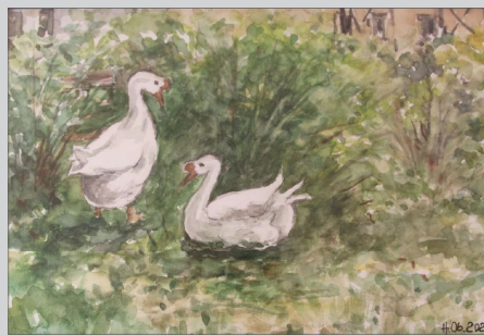
Aquarellgemälde „Die Wahrzeichen von Weinböhla, die beiden Höckergänse Dieter und Auguste“