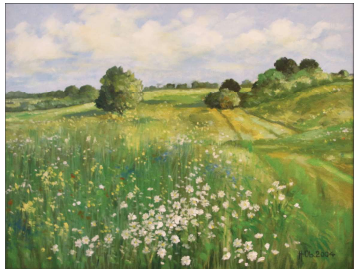
Ölgemälde „Landschaft bei Templin“