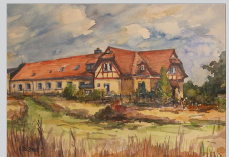
Aquarellgemälde „Das historische Grundstück, Die Lommatzscher“