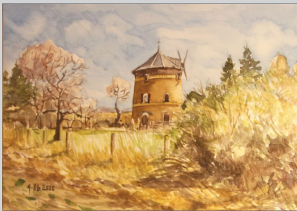
Aquarellgemälde „Die Mühle in Großdobritz“